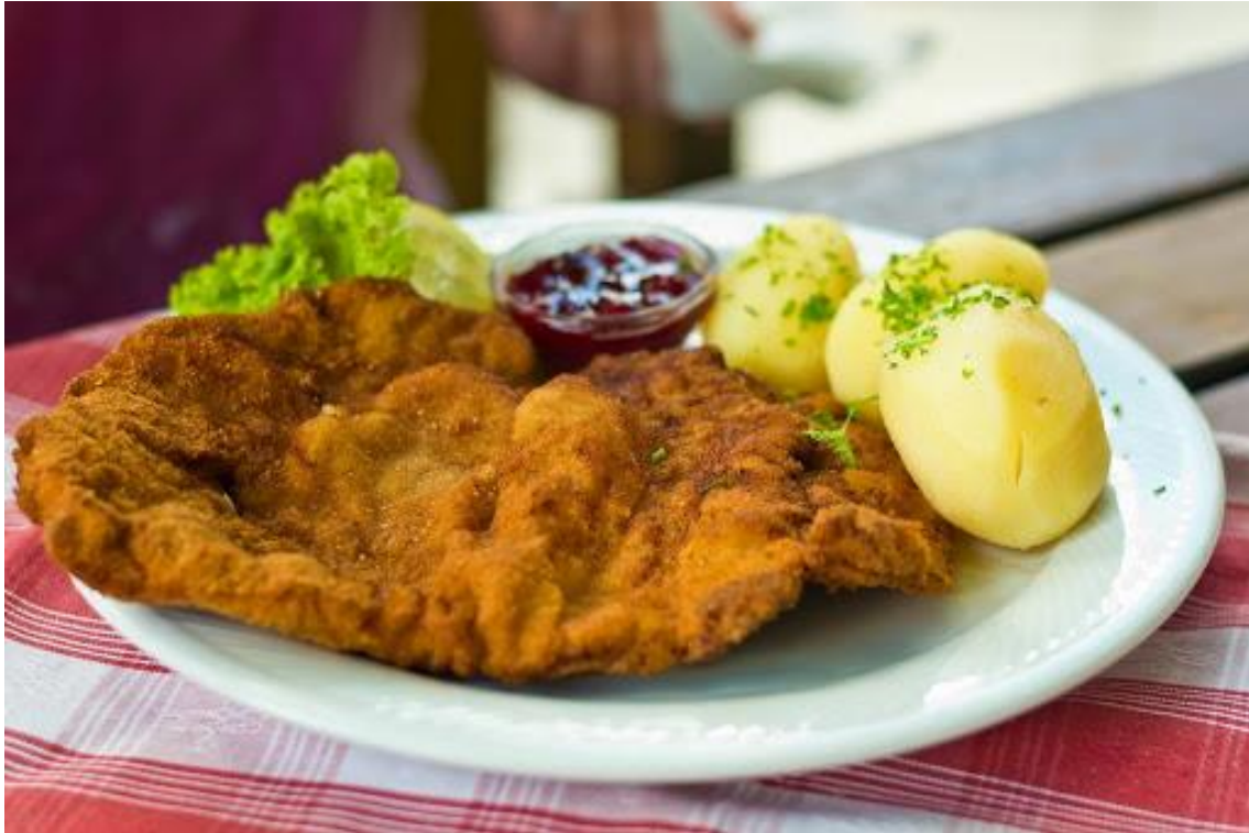
Bečki šnicl (Wiener schnitzel)